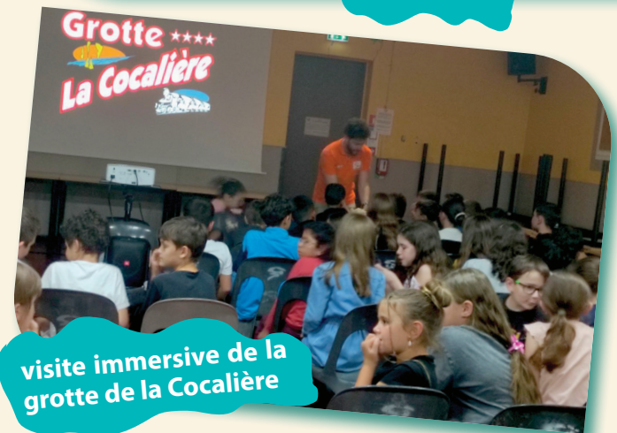
visite immersive de la grotte de la Cocalière