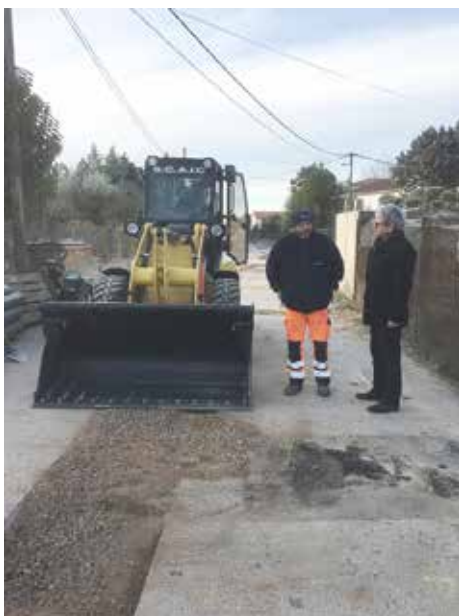
Assainissement chemin des Gayettes