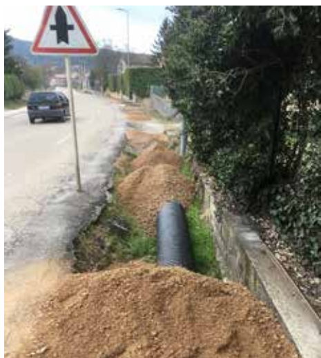
Mise en place du pluvial, avenue des mimosas

Notre commune a pansé ses plaies les plus importantes des inondations de 2014 ... Nous terminons cette année le solde des dernières subventions liées aux inondations de 2015 et reprenons notre rythme d'entretien annuel des voiries comme nous nous y étions engagés dans notre programme de gouvernance.