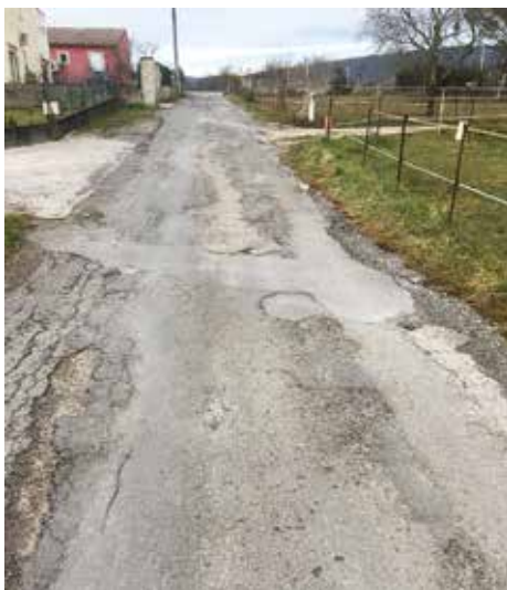
Serre de Courlas : travaux voirie à venir

d'avril. Le chemin sera repris dès ces travaux terminés.