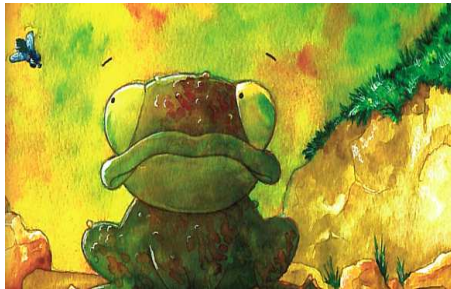
Jojo le crapaud

Animation « petits » : Histoires avec Kamishibai (Le kamishibai, appelé aussi théâtre d'images, est une technique narrative d'origine japonaise qui s'appuie sur des images de grand format défilant dans un castelet en bois à 3 portes, appelé butai), petit film d'animation suivi d'un atelier de modelage puis goûter. Mercredi 15 avril de 14h30 à 17h.