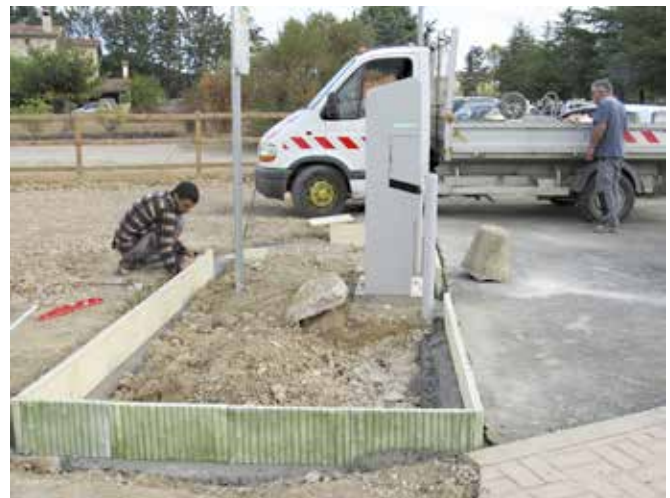
Implantation d'un espace vert à côté de la borne de recharge