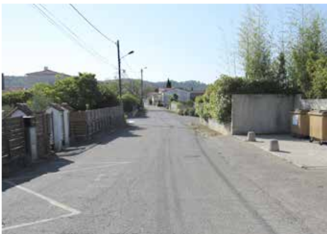
Les Gayettes et Lariasse : futurs chantiers d'assainissement