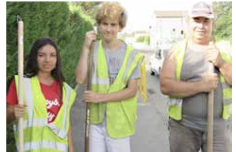
Nettoyage des trottoirs du CD 904

Toute une liste de travaux, qui serait longue si on l'énumérait entièrement.