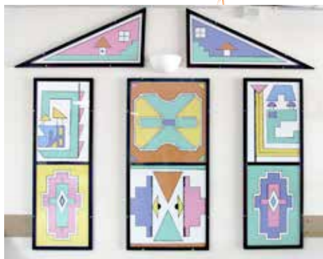
Les M'débélés sont désormais installés dans le hall de l'espace Nelson Mandela