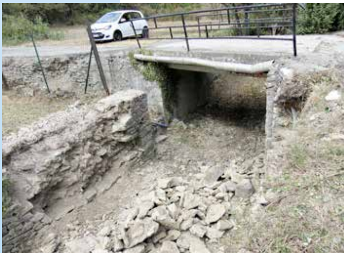
Réfection des murs : ruisseau de Caussonille

Des interventions réalisées par les employés voirie, le personnel d'entretien et les jeunes recrutés en emploi saisonnier. Merci à eux.