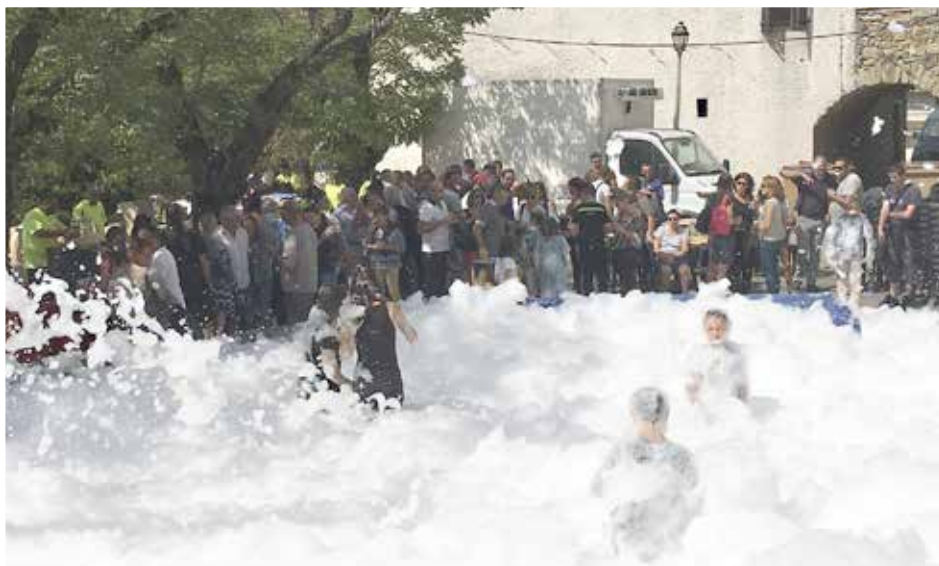
Apéro-mousse pour les enfants !