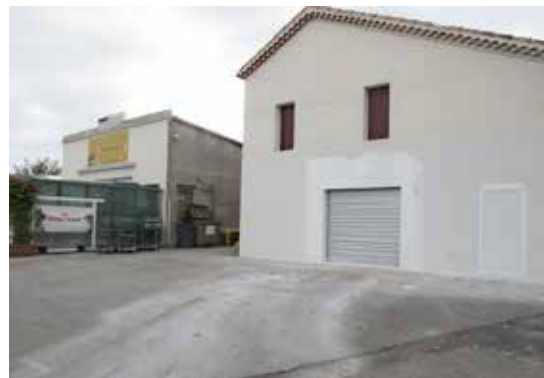
Le bâtiment de la future boucherie

La boucherie a ouvert ses portes aux consommateurs depuis le mardi 10 octobre.