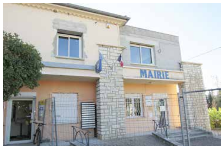
Ouverture d'une fenêtre supplémentaire façade ouest