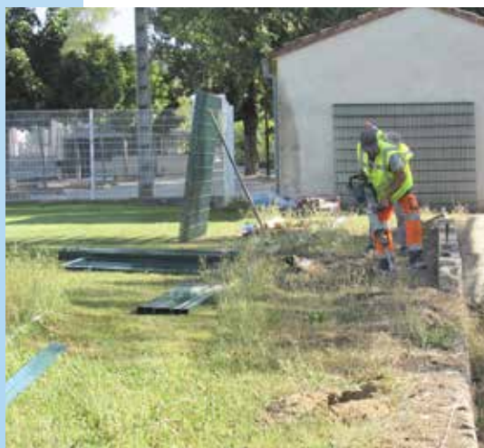
Mise en place de la clôture est du stade