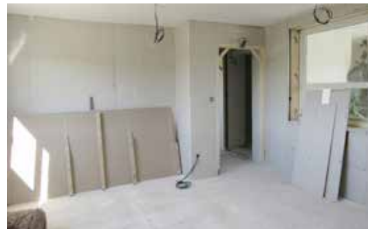
Agrandissement mairie : intérieur/extérieur

À la fin de l'année, les travaux devraient être bien avancés, les anciens bureaux réaménagés, redistribués et les nouveaux, prêts à être investis. Une cure de rajeunissement nécessaire pour répondre aux demandes de plus en plus nombreuses de nos concitoyens dans des conditions plus agréables pour tous.