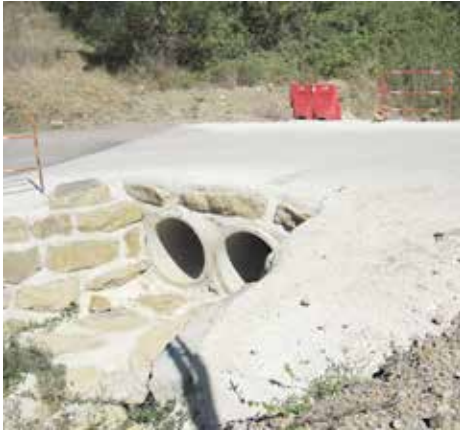
Sécurisation de la voirie : chemins de la caserne et d'Arbousse