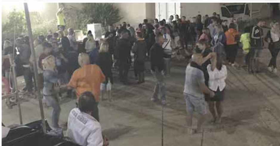
Soirée dansante à St Julien

Pour la 3 e année, le Comité des fêtes a organisé dans la joie et la bonne humeur, sa fête le premier weekend de septembre.