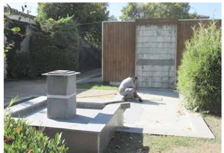
Décapage du bassin près de l'école