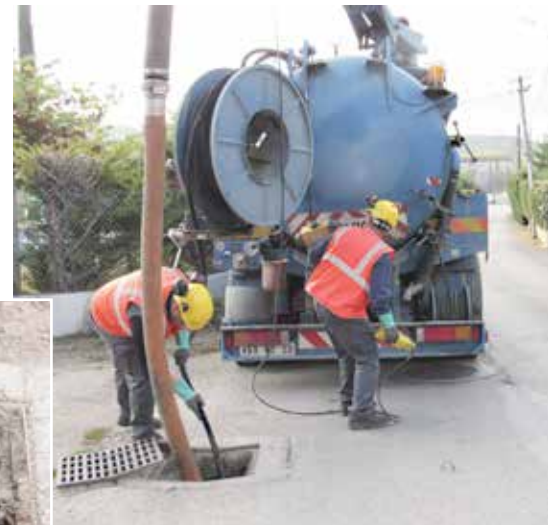
Désobstruction des buses pluviales

Un grand merci aux agents de VEOLIA qui se sont montrés à l'écoute et très disponibles dans l'exercice de leur mission.