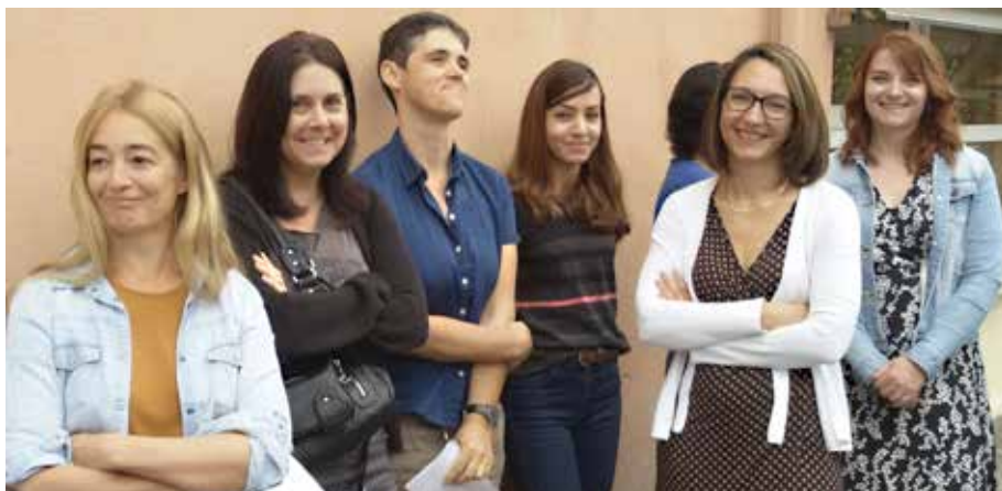
Une partie de l'équipe enseignante

Soit un total de 349 élèves dans nos deux écoles Émile BEDOS et Pierre PERRET.