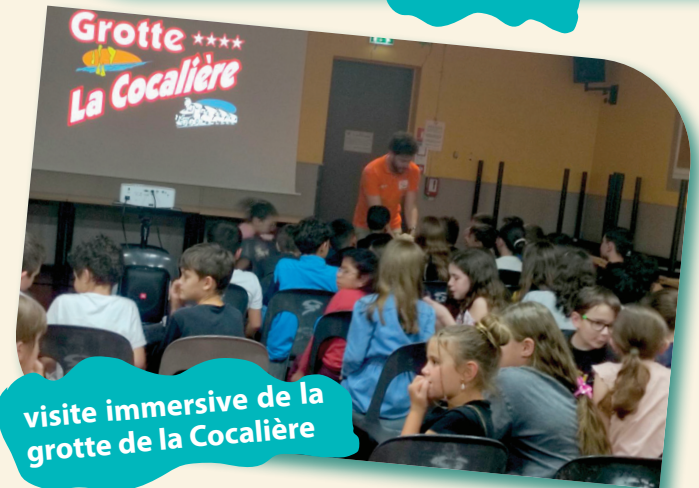
visite immersive de la grotte de la Cocalière