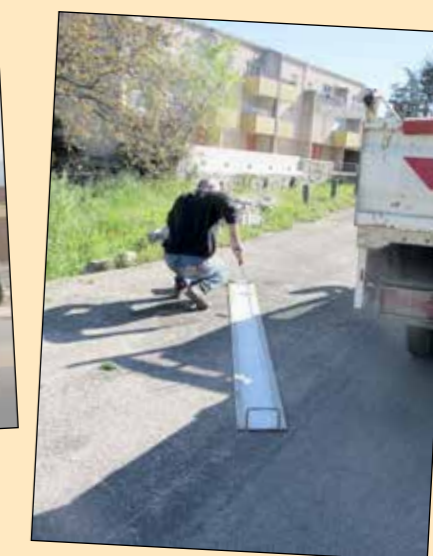
• Marquage routier