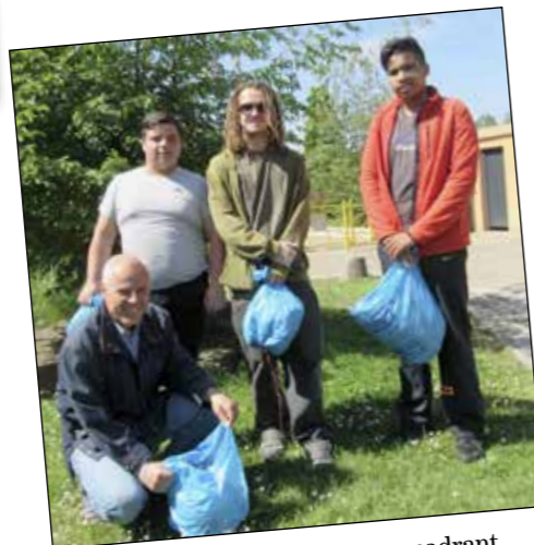
Les jeunes de la P.J.J. et leur encadrant

11 JUIN 2016 : Réservez votre matinée pour venir participer à l'opération village propre à l'occasion de la journée éco-citoyenne.