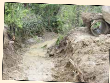
• Réfection passage busé (avant/après)