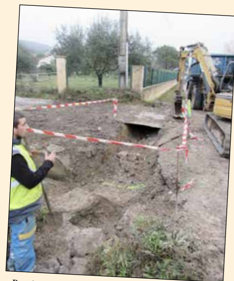
• Reprise du pluvial route de Saint Martin