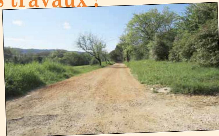
• Réfection chemin des Fontes