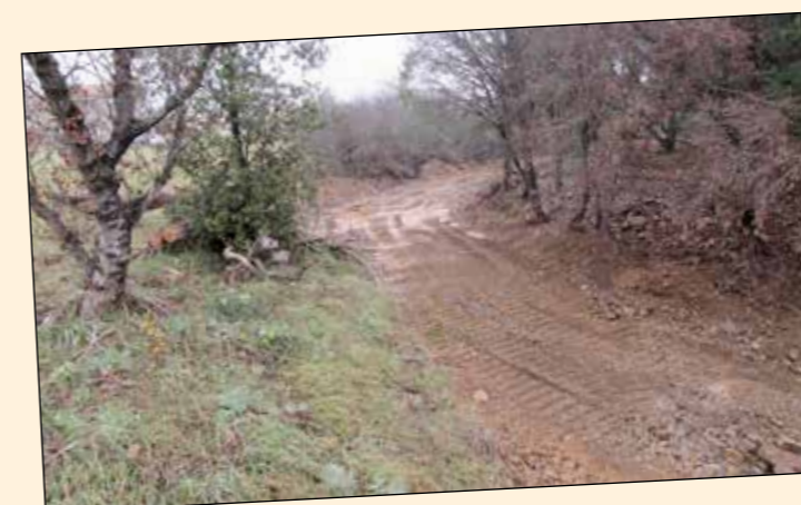
• Reprise du lit du ruisseau rouge