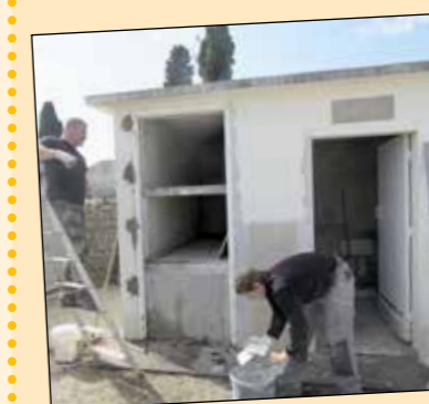
• Dépositoire (avant/après)