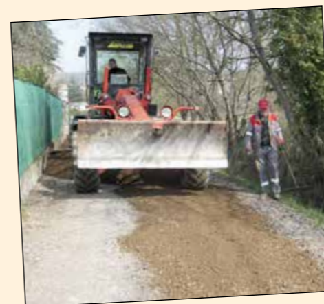
• Réfection chemin des Tribes