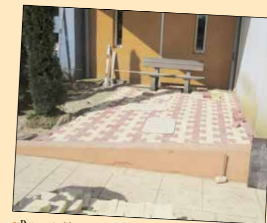
• Pose auto-bloquants espace Jeunes Mandela