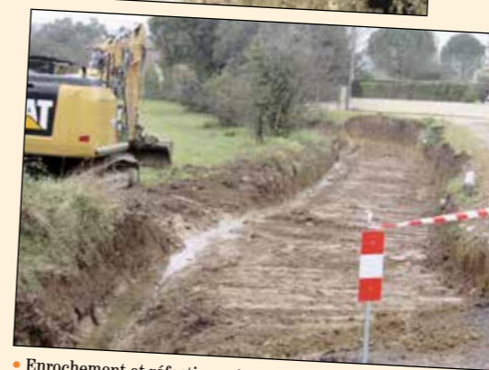
• Engrochement et réfection ruisseau des Gayettes