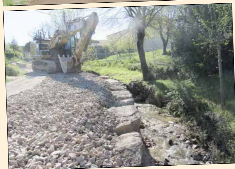
• Réfection et engrochement chemin des Ayres