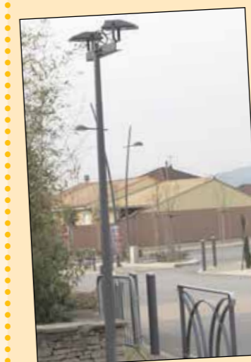
• Éclairage public devant la mairie