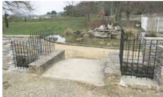
• Dépose de grilles au Carabiol

Comme chaque année, le site du carabiol sort de sa torpeur hivernale avec les premiers rayons de soleil. Les enfants reprennent possession des lieux et le site reprend vie !