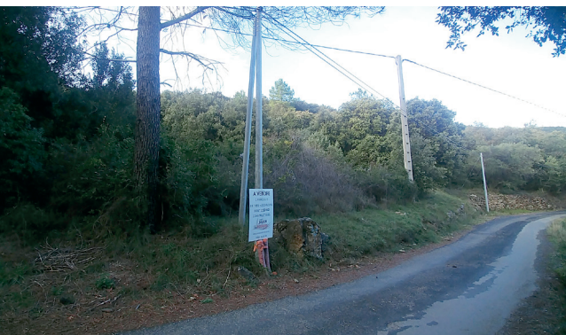
• Photo terrain Arbousse côté route

Une commission d'attribution sera créée qui élaborera des critères d'éligibilité les plus transparents possibles. Un dossier vous sera alors envoyé.